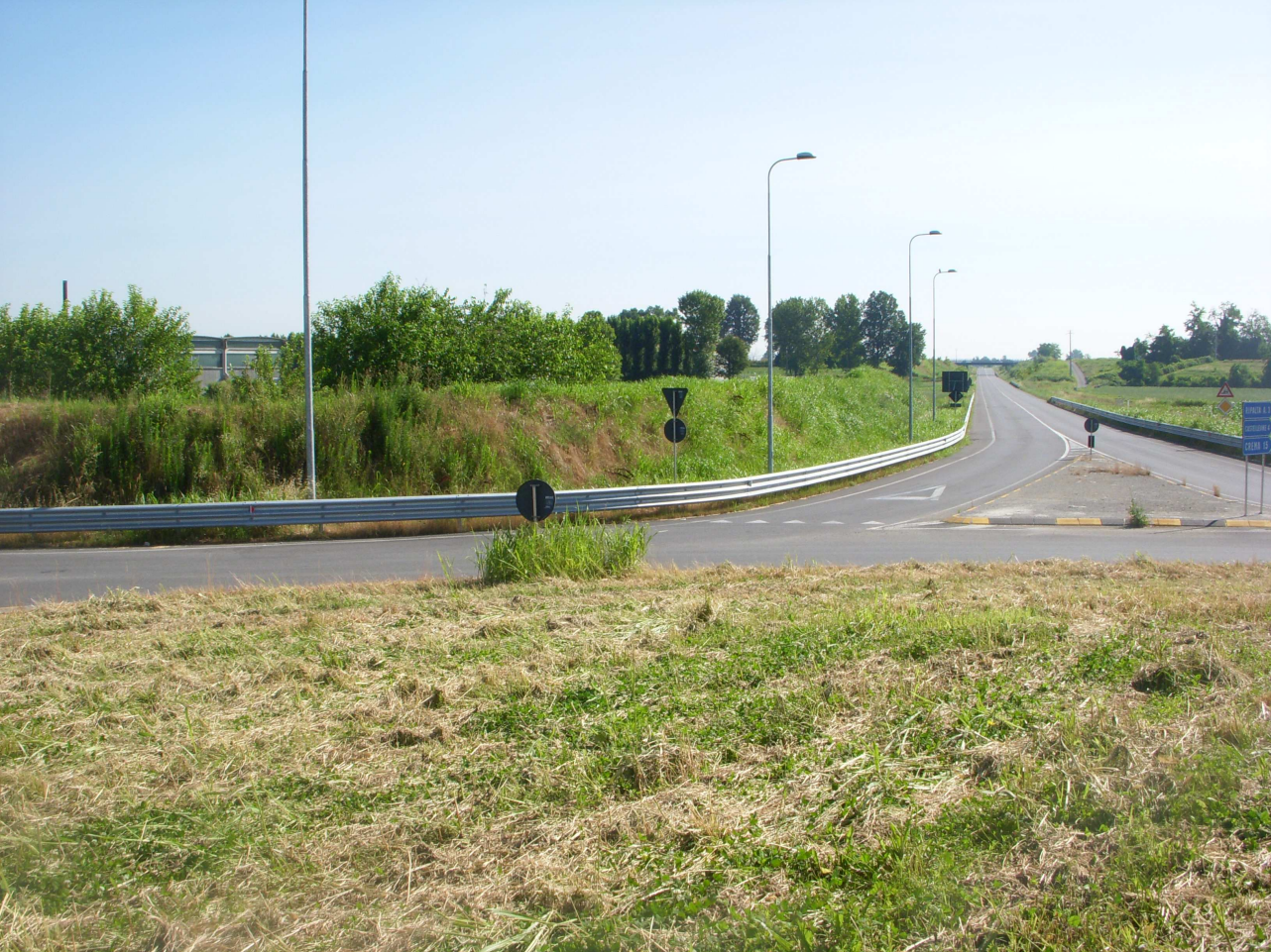
FOTOGRAFIA N. 2